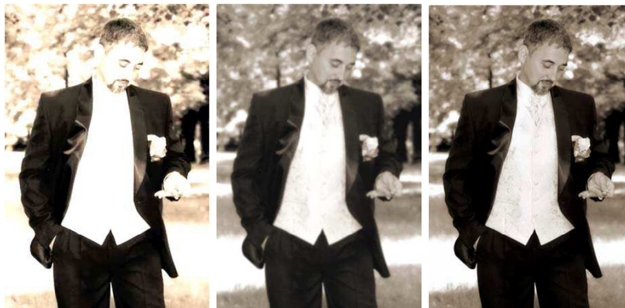
Kiégett a kép

De, hogy lássuk ezt a gyakorlatban is, mutatnék Neked pár szemmel látható példát: